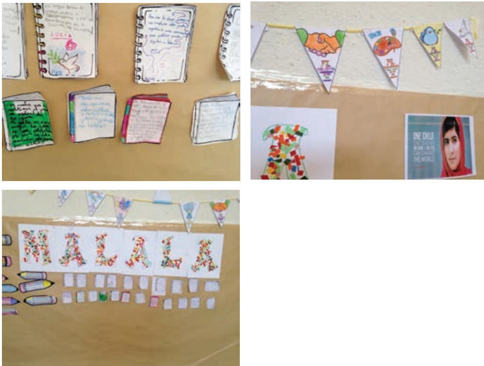
Imágenes de los trabajos realizados por los alumnos de Educación Infantil y Primaria en las actividades planteadas en el proyecto

En nuestro proyecto educativo nos centramos de forma prioritaria en las competencias: