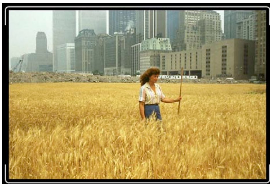
Agnes Denes, Wheatfield—A Confrontation, Downtown Manhattan, (1982)

En 2004 el Chelsea Art Museum realizó una retrospectiva de la artista Agnes Denes bajo el título Agnes Denes: Proyectos para Espacios Públicos. Considerada como una de las pioneras del arte conceptual y medioambiental, Denes inicia su carrera artística en 1968 y lleva tras de sí más de 350 exposiciones individuales y colectivas. Su producción incluye proyectos en dibujo, fotografía, intervenciones e instalaciones.